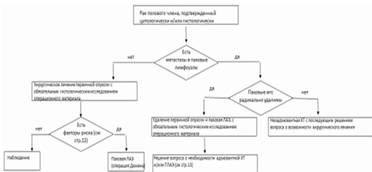
Схема 1. Блок-схема лечения пациента с верифицированным раком полового члена