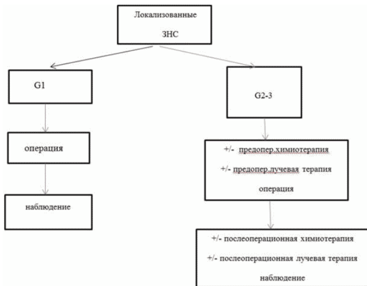
Рис. 1. Схема лечения пациентов с локализованными забрюшинными неорганными саркомами